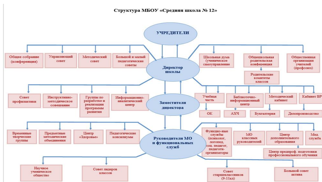
Схема № 1.

В 2020 году была усилена роль Управляющего Совета школы в обеспечении развития общественного участия в управлении образовательным процессом.